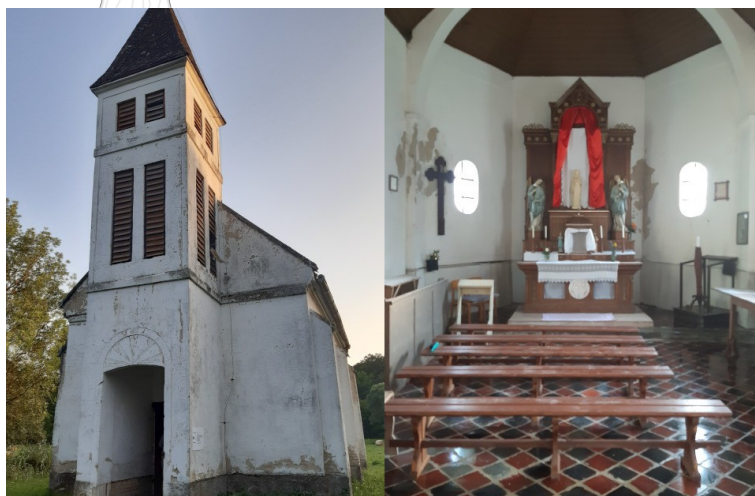
3. Ábra: A latin szentmise helyszíne: a papdi kápolna

A tábor előkészítése során felkészítést kaptak a gyerekek a kezesség ókori gyakorlatáról, és az ókeresztény egyház beavató, és felkészítő folyamatáról. Az 1965-ig egyetlen rítus gazdag jelentésvilágát, a hittartalmak megértését segítő mozzanatait, a misézés részletes rendjét befolyásoló mozzanatok, az oltár (és oltárkö) jelentőségének megértését segítette. A Krisztus felé forduló figyelem nagy tanító erővel bír azok számára, akik szóbeli ismertetést követően vesznek részt egy hagyományos szentmisén. A szentmisét egy erdőben álló kis kápol-